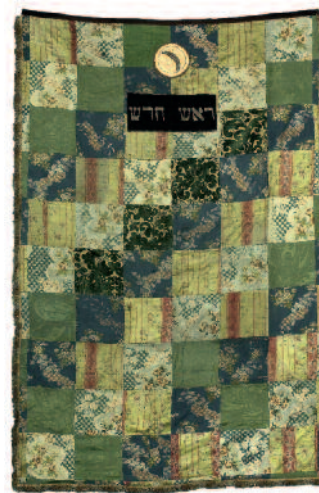
Tora-Vorhang, um 1900, Sammlung JMW

Führungspauschale: 40,- (60 Minuten) bzw. 60,- (90 Minuten) pro Gruppe