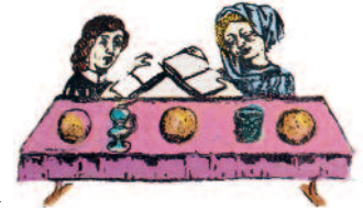
Lesen der Haggada, 1996, Nancy Spero, Installation der Erinnerung, 1996