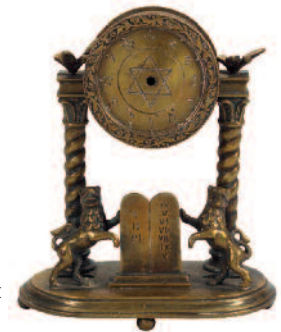
Miniatur-Kommodenuhr, 2. Hälfte 19. Jhd., Sammlung Berger

Das Museum aus der Nähe. Was Sie schon immer wissen wollten und noch nie gefragt haben – zwei Stunden Museum und Ausklang im Café, maximal 4 TeilnehmerInnen Kosten: € 100,-/Gruppe