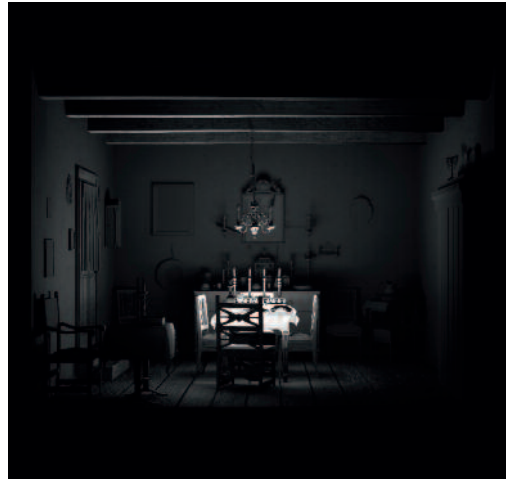
Maya Zack The Shabbat Room , 2013