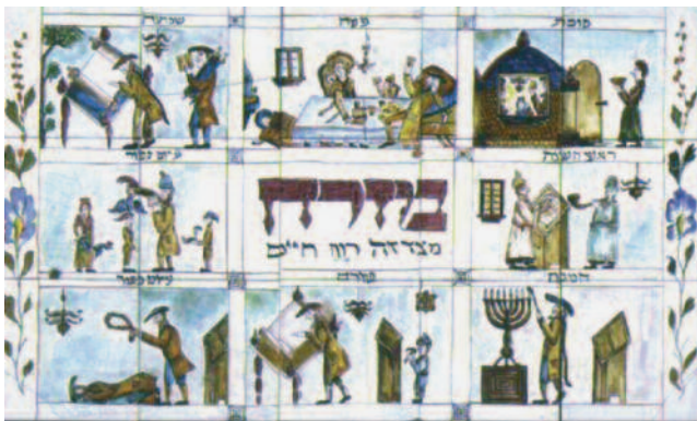
Misrach-Tafel, 19. Jhd., Sammlung JMW

Führungspauschale: 40,- (60 Minuten) bzw. 60,- (90 Minuten) pro Gruppe