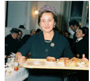
Chanukka 1966, JMW, Fotoarchiv Dobronyi

Führungspauschale: 40,- (60 Minuten) bzw. 60,- (90 Minuten) pro Gruppe (exkl. Frühstück) cafe.eskeles@gmail.com www.cafe-eskeles.eu