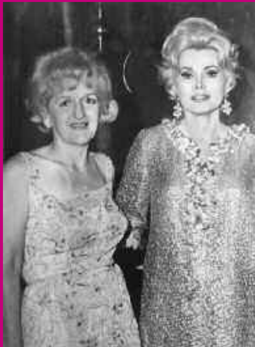
Trude und Zsa Zsa Gabor, 1967. Trude and Zsa Zsa Gabor, 1967.