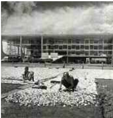
Plattenleger auf der Baustelle von Brasília / Paver during the construction of Brasília, 1959