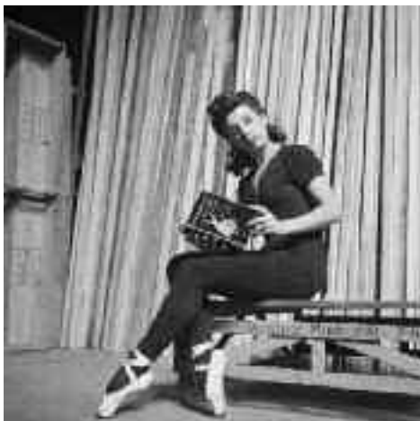
Tänzerin des Studentenballetts / Dancer from the student ballet, Rio de Janeiro, 1943