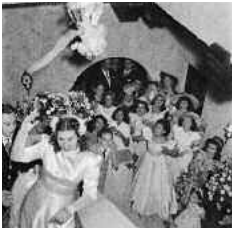
Brautstraußwerfen, / Throwing the bride's bouquet, 1949/50