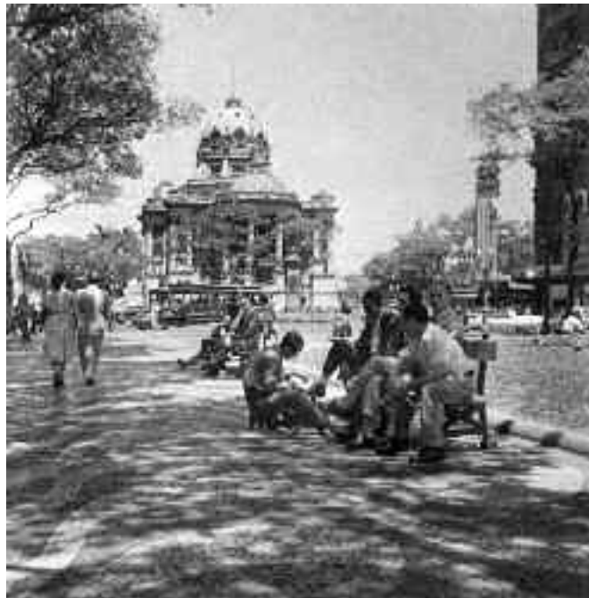
Schuhputzer vor dem Palácio Monroe / Shoeshine boy in front of Palácio Monroe, Cinelandia, Rio de Janeiro, 1940er-Jahre / 1940s