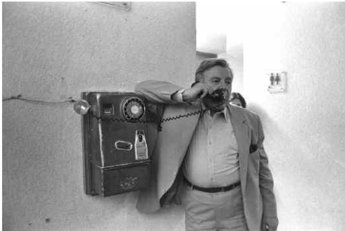
Der rastlose Bürgermeister meldet Handlungsbedarf an sein Büro, 1985 The indefatigable mayor notifies his office about a need to take action, 1985