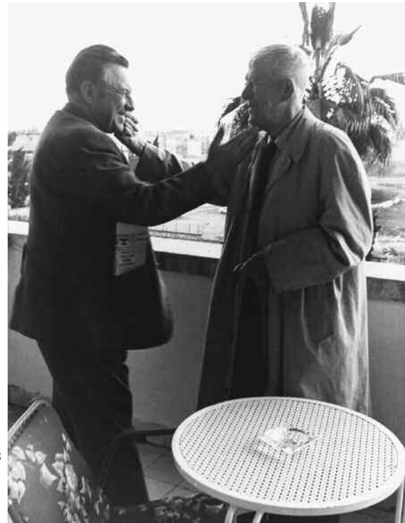
Mit Oskar Kokoschka, 1973 With Oskar Kokoschka, 1973