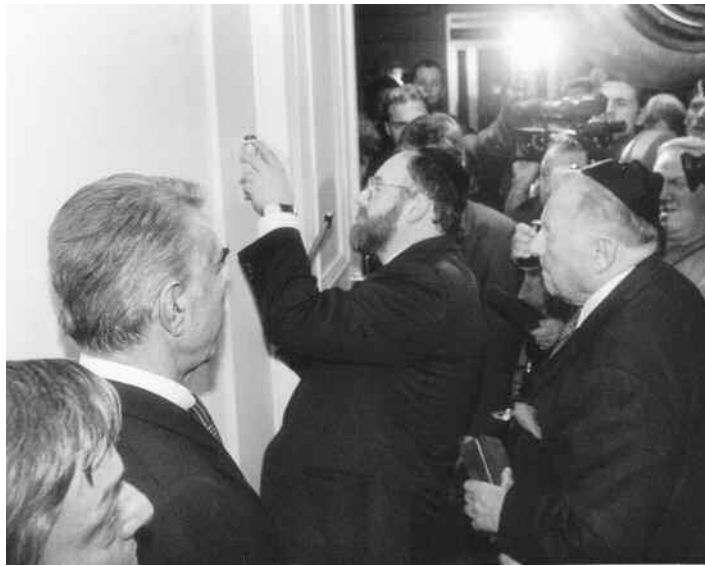
Helmut Zilk, Paul Chaim Eisenberg und Teddy Kollek bei der Eröffnung des JMW, 1993 Helmut Zilk, Paul Chaim Eisenberg and Teddy Kollek at the opening of the Jewish Museum Vienna, 1993