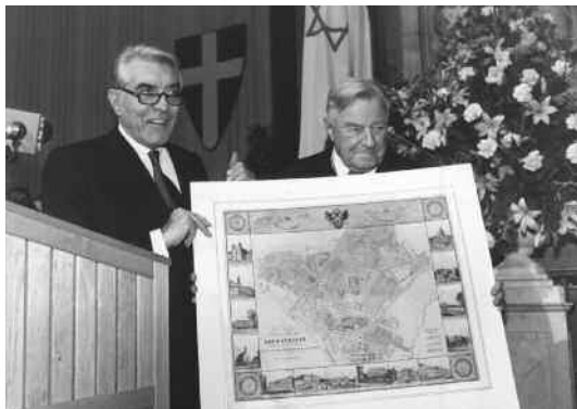
Helmut Zilk und Teddy Kollek im Wiener Rathaus, 1993 Helmut Zilk and Teddy Kollek at the Vienna City Hall, 1993