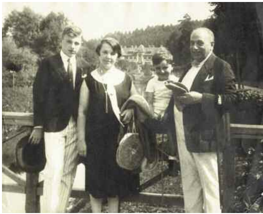
Teddy Kollek mit seiner Familie in Kartsbad, 1925 Teddy Kollek (left) with his family in Karlovy Vary, 1925