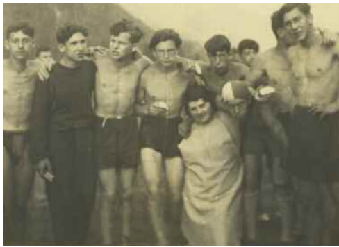
Teddy Kollek (dritter von links) bei der zionistischen Jugendorganisation Blau-Weiß, um 1925 Teddy Kollek (third from the left) at the Zionist youth organization Blau-Weiß, ca. 1925