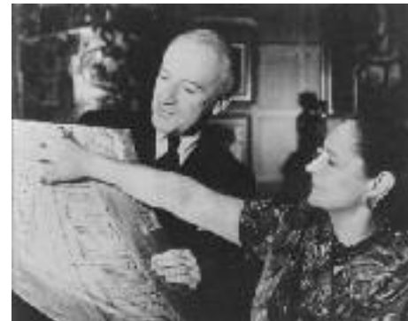
Mit dem Fotografen Cecil Beaton bei der Planung der privaten Kunstgalerie / With the photographer Cecil Beaton, planning the private art gallery, 1959