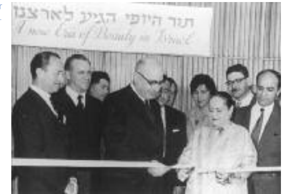
Eröffnung der Fabrik / Opening of the factory in Tel Aviv, 1962