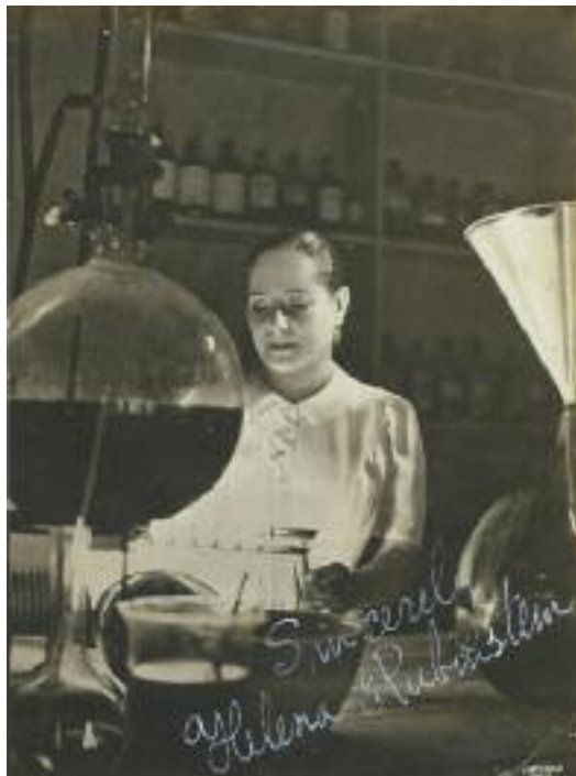
In der Fabrik / In the factory, St. Cloud, ca. 1932; Photo: Boris Lipnitzki / Studio Lipnitzki, © Roger-Viollet; Privatsammlung / Private Collection