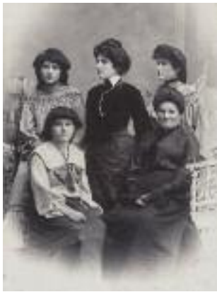
Helena (Mitte) mit drei ihrer Schwestern und ihrer Mutter in Krakau / Helena (center) with three of her sisters and her mother in Krakow, ca. 1905