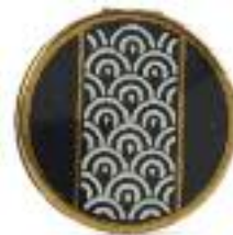
Puderdose, 1930er-Jahre / Powder box, 1930s