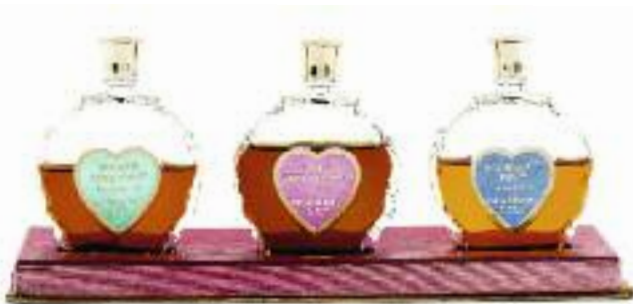
Geschenkbbox / Gift Box, Eau de Parfum Command Performance, Moonlight Mist, Fourth Dimension, 1957 ; Archiv / Archives Helena Rubinstein