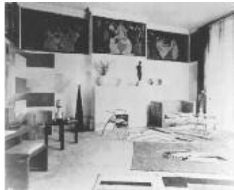
Salon in Paris, Rue du Faubourg Saint-Honoré 52, ca. 1928