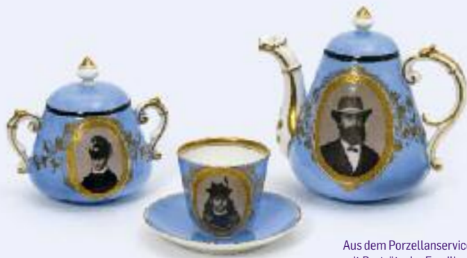
Aus dem Porzellanservice mit Porträts der Familie Szepe, um 1868 From the porcelain service with portraits of the Szepe family, ca. 1868 Wien Museum, HMW 303.164