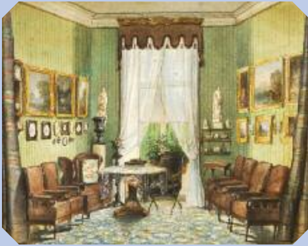
Fanny von Arnsteins Salon am Hohen Markt Fanny von Arnstein's salon on Hoher Markt Anfang 19. Jh./beginning of 19th century Stg./Coll. JMW, Inv. Nr. 15475