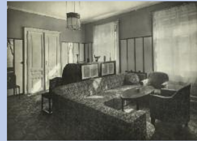
Bibliothekszimmer Berta Zuckerkandls in der Oppolzer- gasse 6, von Josef Hoffmann gestaltet Berta Zuckerkandl's library room in the apartment designed by Josef Hoffmann at Oppolzer-gasse 6