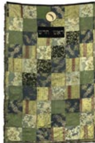
Tora-Vorhang, um 1900, Sammlung JMW

Führungspauschale: 40,- (60 Minuten) bzw. 60,- (90 Minuten) pro Gruppe