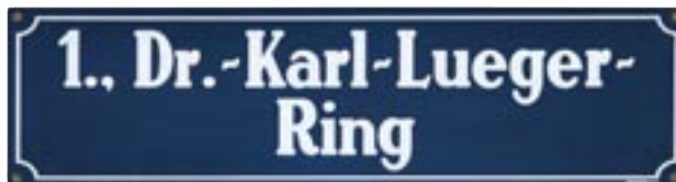
Straßenschild Dr.-Karl-Lueger-Ring, Wien, Ende 20. Jhd.

Führungspauschale: 40,- (60 Minuten) bzw. 60,- (90 Minuten) pro Gruppe