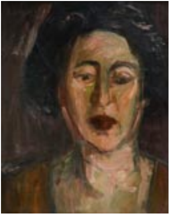
Porträt Hilde Spiel Georg Eisler, Wien 1967