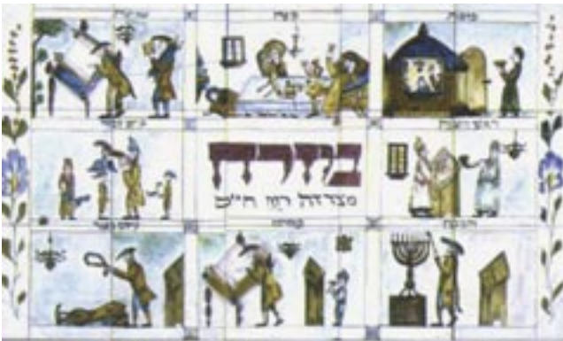
Misrach-Tafel, 19. Jhd., Sammlung JMW

Führungspauschale: 40,- (60 Minuten) bzw. 60,- (90 Minuten) pro Gruppe