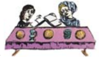
Lesen der Haggada, 1996, Nancy Spero, Installation der Erinnerung, 1996

Führungspauschale: 40,- (60 Minuten) bzw. 60,- (90 Minuten) pro Gruppe