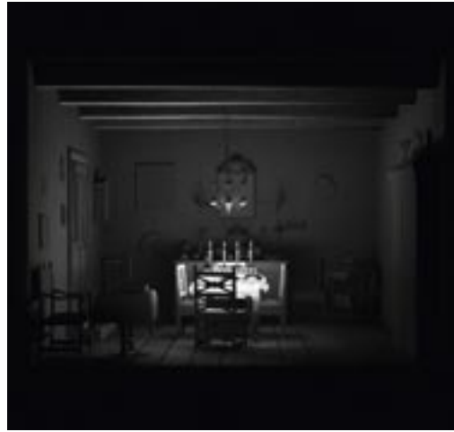
Maya Zack The Shabbat Room , 2013