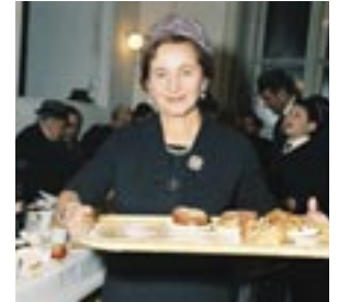
Chanukka 1966

Führungspauschale: 40,- (60 Minuten) bzw. 60,- (90 Minuten) pro Gruppe (exkl. Frühstück) cafe.eskeles@gmail.com www.cafe-eskeles.eu