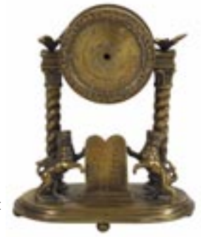
Miniatur-Kommodenuhr, 2. Hälfte 19. Jhd., Sammlung Berger