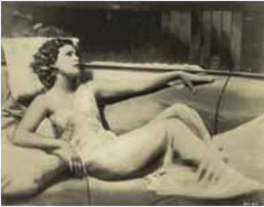
Star-Foto für Ekstase , 1933 Publicity photo for Ecstasy , 1933