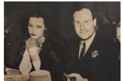
Hedy und Fritz Mandl, um 1935 Hedy and Fritz Mandl, c. 1935